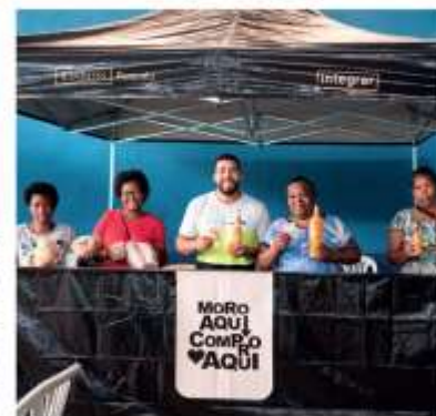
Primeira edição da feira itinerante no Cunha