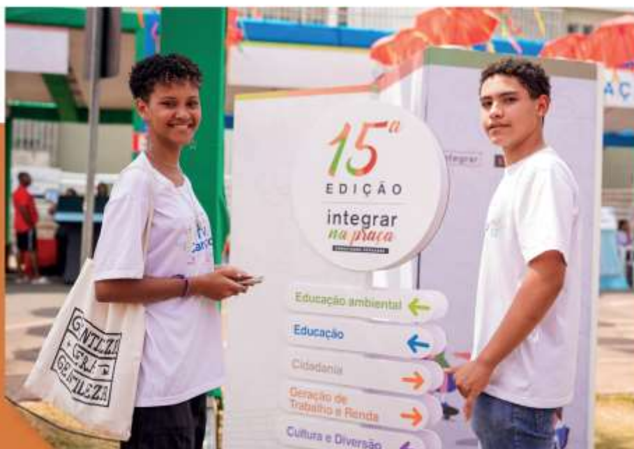
Integrar na sua 15ª edição