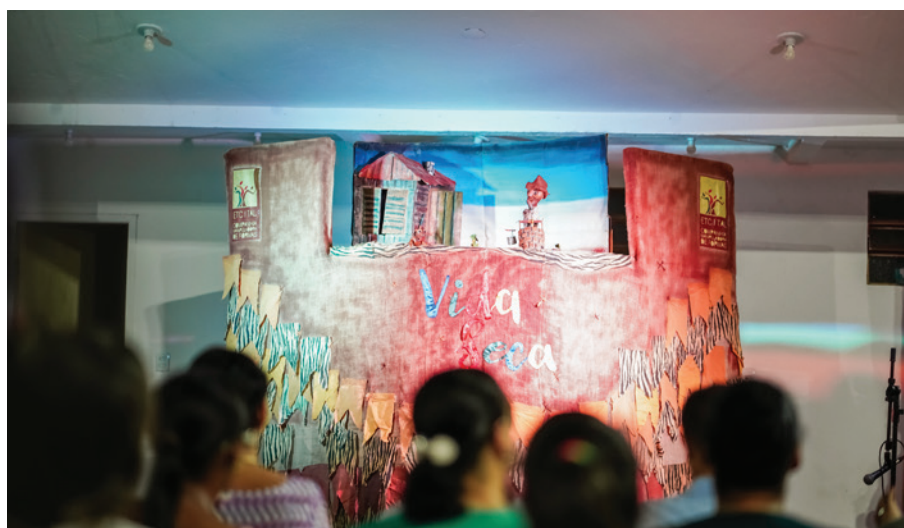
▲ Primeira edição do Projeto Cultural.

A oficina do Enem Te Conto retornou este ano para preparar os(as) estudantes para a etapa de redação de concurso e principalmente de vestibulares.