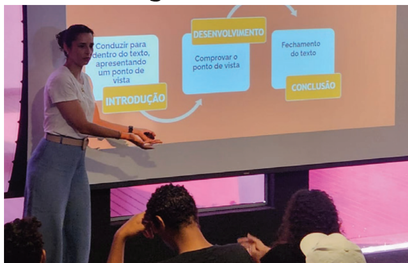
▲ A parceria com a Academia de Letras proporciona educação e cultura aos(as) jovens.