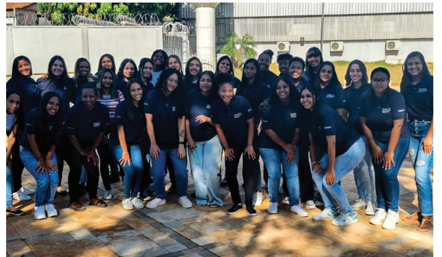
► As vagas afirmativas para mulheres têm criado um ambiente mais inclusivo na indústria.

Novas vagas, quando abertas, são disponibilizadas para todos e todas. Fique de olho no site www.kinross.com.br e inscreva-se naquela que tem a ver com o seu perfil profissional.