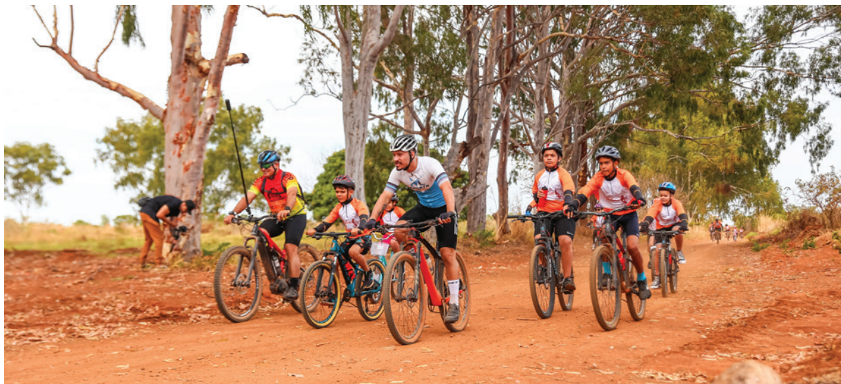
O Pedal no Cerrado reuniu adultos(as) e crianças da comunidade.