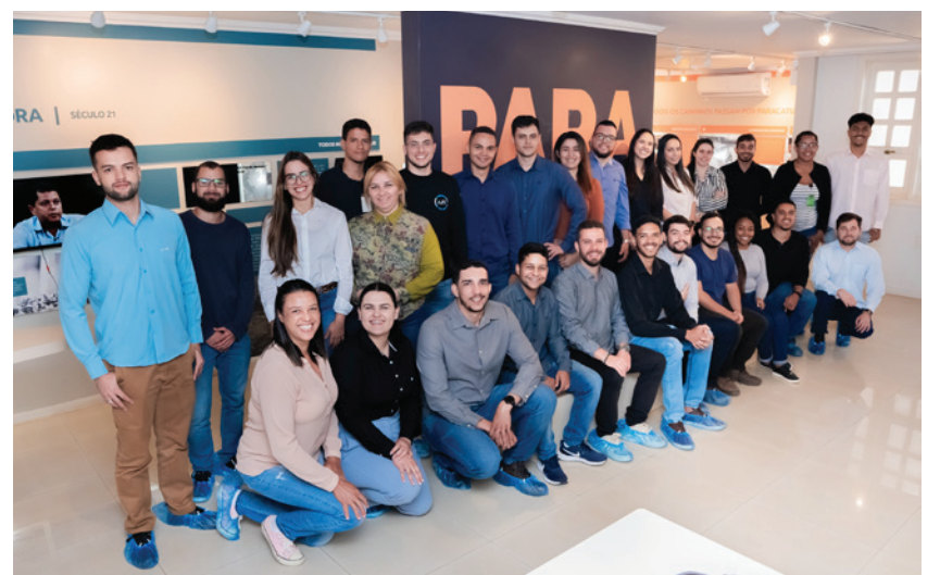
► Programa de Estágio da Kinross abre portas para o crescimento de jovens.