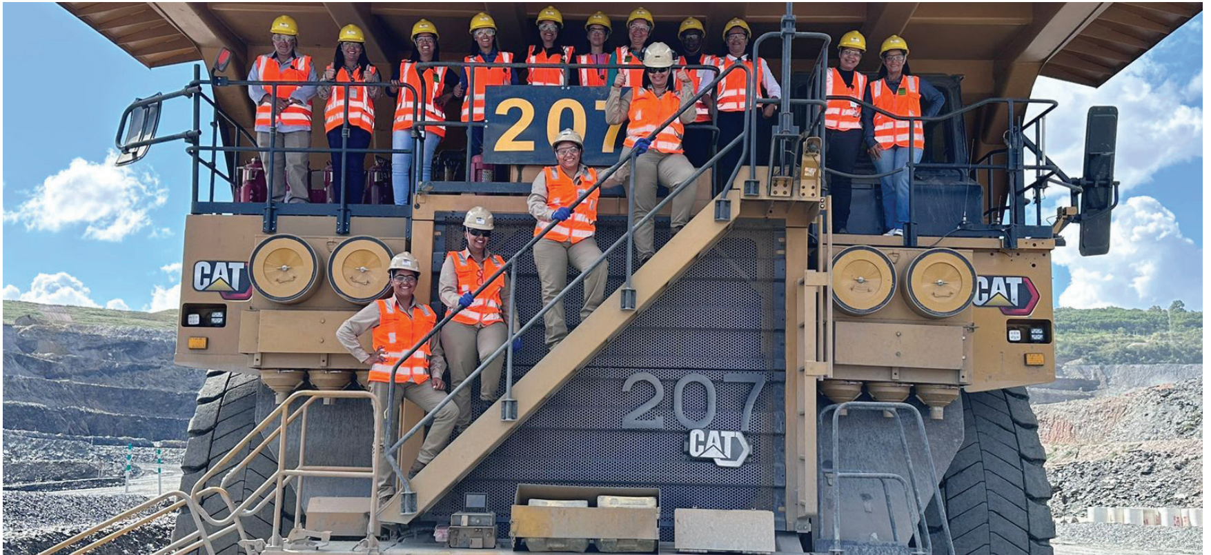
► Mais mulheres estão sendo qualificadas para operarem equipamentos móveis.

Novas oportunidades, programas e vagas afirmativas para mulheres. A Kinross trabalha de forma contínua em ações para que a comunidade tenha cada vez mais opções de ingressar na Empresa. O Programa de Estágio foi um deles. No seu lançamento, em junho deste ano, mais de 1.500 estudantes se inscreveram e 43 foram selecionados(as). O programa foi um sucesso na sua primeira edição.