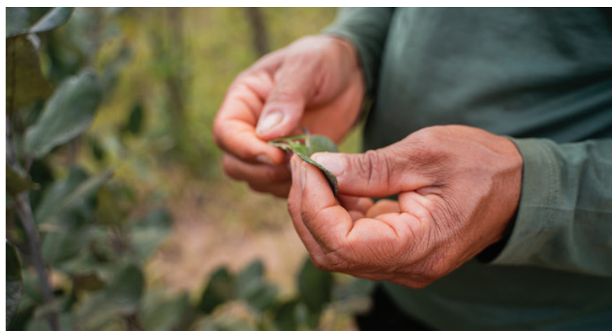
Produção de mudas gera renda extra e promove a sustentabilidade.