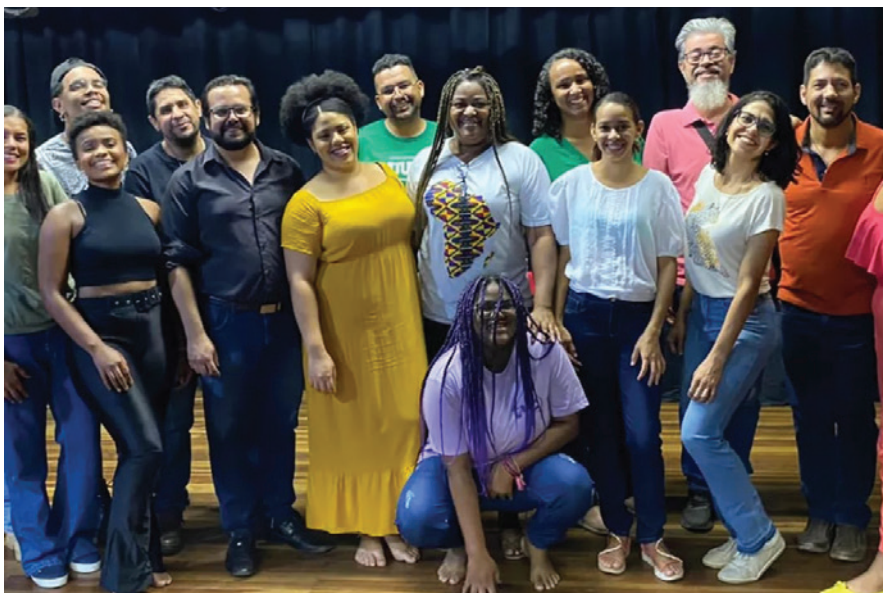
▶ Alunos formados pelo programa.

A iniciativa, patrocinada pela Kinross via Lei de Incentivo, surgiu a partir de uma percepção do Instituto do Teatro Brasileiro sobre a carência de formação qualificada nas áreas técnicas e de produção em artes cênicas em um mercado de trabalho que possui boa capacidade de absorção de mão de obra e tem somado para a formação de novos(as) profissionais.