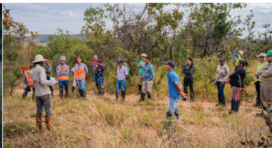
Moradores(as) da comunidade recebem instruções de plantio de mudas.

Desde 2017, a Kinross apoia um projeto de viveiros comunitários na comunidade do Santa Rita. No início da iniciativa, foram mapeados(as) 20 pequenos(as) produtores(as) rurais, e a empresa construiu, em cada uma das propriedades, um viveiro para produção de mudas.