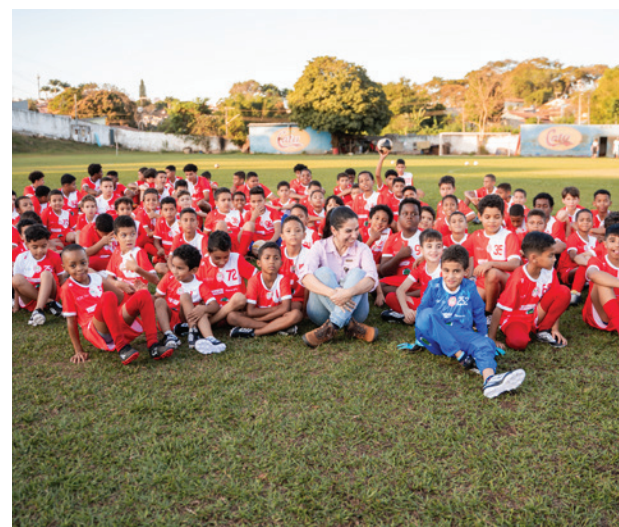
O esporte faz parte do dia a dia das crianças em Paracatu.

“Vejo o quanto o meu filho e os(as) outros(as) participantes amam os treinos. É bonito ver a esperança e a dedicação, o sonho das crianças em serem jogadores(as). Os olhinhos brilham! Além do esporte, o projeto contribui para o crescimento pessoal das crianças, colaborando para a comunidade. Hoje, além de gratidão, podemos falar que foi dentro do campo, e junto dos(as) colegas e técnicos, que meu filho conseguiu passar por esse momento” , finaliza.