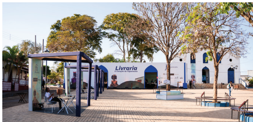
▲ Livraria do Fliparacatu instalada na Praça do Rosário.